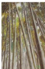
妻田忠士 とどげ 天まで