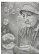
咲久 泡沫(うたかた)